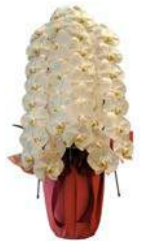
3本立ち胡蝶蘭→ 42～45輪 B-05クラス