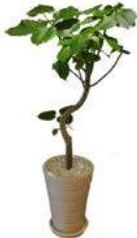
ウンベラータ (幹：曲がり)