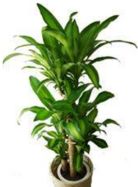
ドラセナ (マッサンゲアナ)