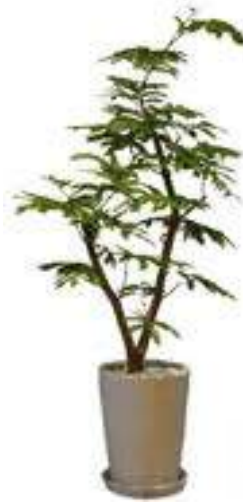
エバーフレッシュ