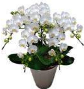
A-02 5本立ち(白) 19,800円