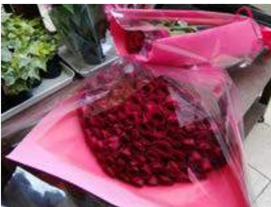
赤バラ 108 本花束