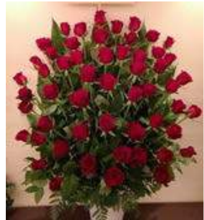
27,500 円→ (高級バラ)