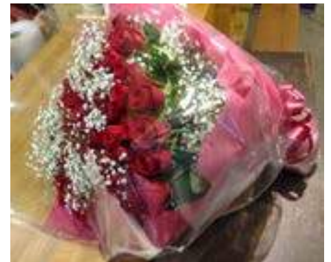
高級赤バラ 80 本の花束 特別注文