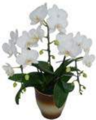
A-01 3本立ち(白) 13,200円