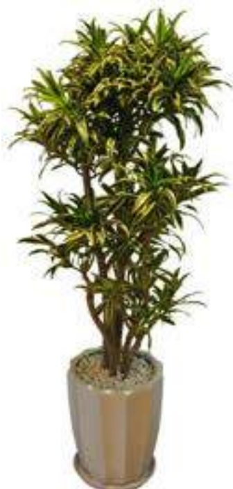
ドラセナ (ソングオブインディオ)