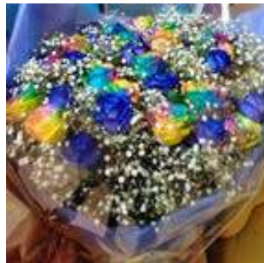
青+レインボーバラの花束 特別注文