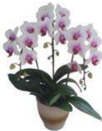
A-03 3本立ち(ピンク) 13,200円