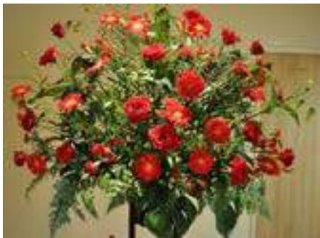
← D1-13200 (スタンド ノーマルタイプ)