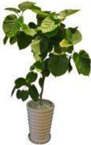
ウンベラータ (幹：まっすぐ)