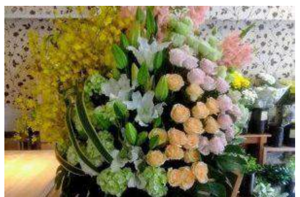
オリジナルスタンド