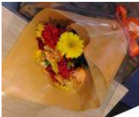
スタンダードタイプ： 3,530 円