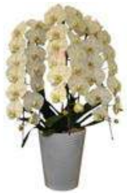
←3本立ち胡蝶蘭 33～36輪 B-03クラス