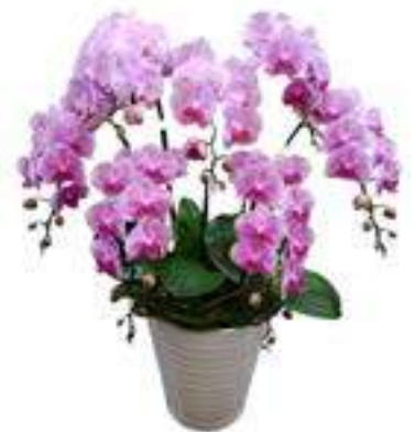
A-04 5本立ち(ピンク) 19,800円